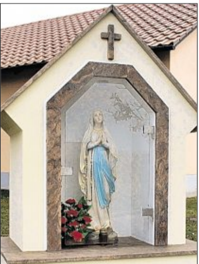
Zum Dank für den unfallfreien Bau des Gemeinschaftshauses errichtete die Dorfgemeinschaft Winbuch diese Grotte.

Dorfgemeinschaft Winbuch leistet viel in Eigenregie – Kirwa und Weinfest